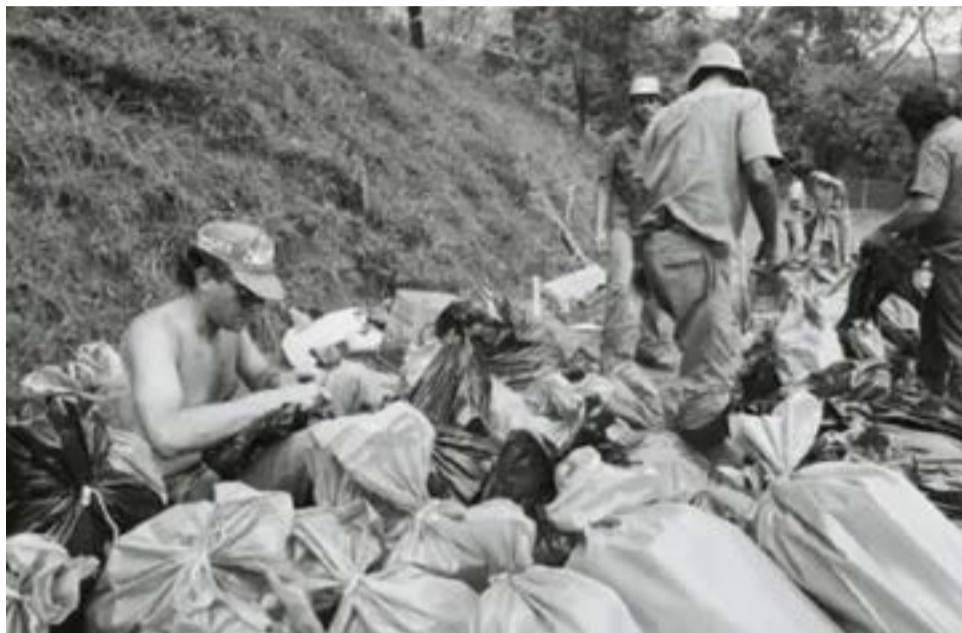
Recuperação de ossadas de presos políticos no Cemitério Dom Bosco, em Perus, São Paulo. - Marcelo Vigneron/Memorial da Resistência

No início do governo Lula, em 2023, o Ministério dos Direitos Humanos e da Cidadania adotou medidas administrativas e jurídicas para o restabelecimento da comissão. O Ministério Público Federal também recomendou a reinstalação con-