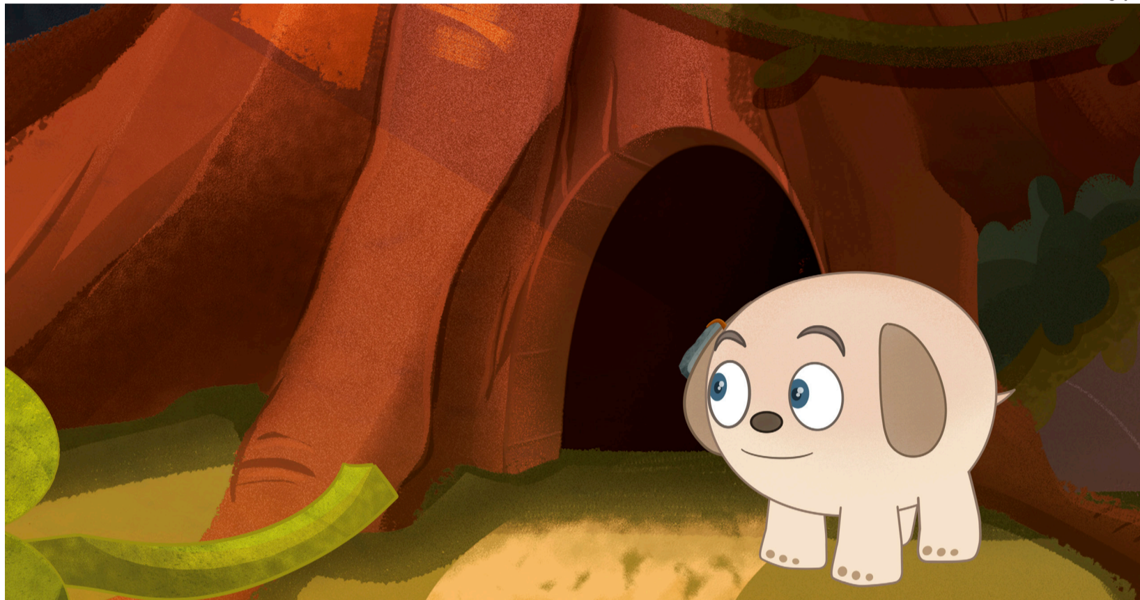
POCÓ personagem principal no filme A Ilha dos Ilus