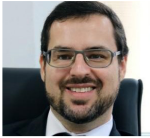
ANDRÉ NAVES Defensor Público Federal, especialista em Direitos Humanos, Inclusão Social e Economia Política. Escritor e professor (@andrenaves.def).

As crises ambientais que enfrentamos atualmente, expressas por meio de queimadas, enchentes e outros desastres naturais, são reflexos de um modelo de sociedade que prioriza o produtivismo estéril e o consumismo perdulário. Este sistema, ao invés de preservar e valorizar os recursos naturais, os exaure em um ritmo alarmante, levando a humanidade a uma rota de autodestruição. Recentemente, vimos as severas secas na Amazônia, acompanhadas por ondas de calor e frio extremos em diversas partes do país. A recente tragédia no Rio Grande do Sul, que ficou submerso por semanas devido às enchentes, foi um claro exemplo, ainda fresco em nossa memória, dos impactos