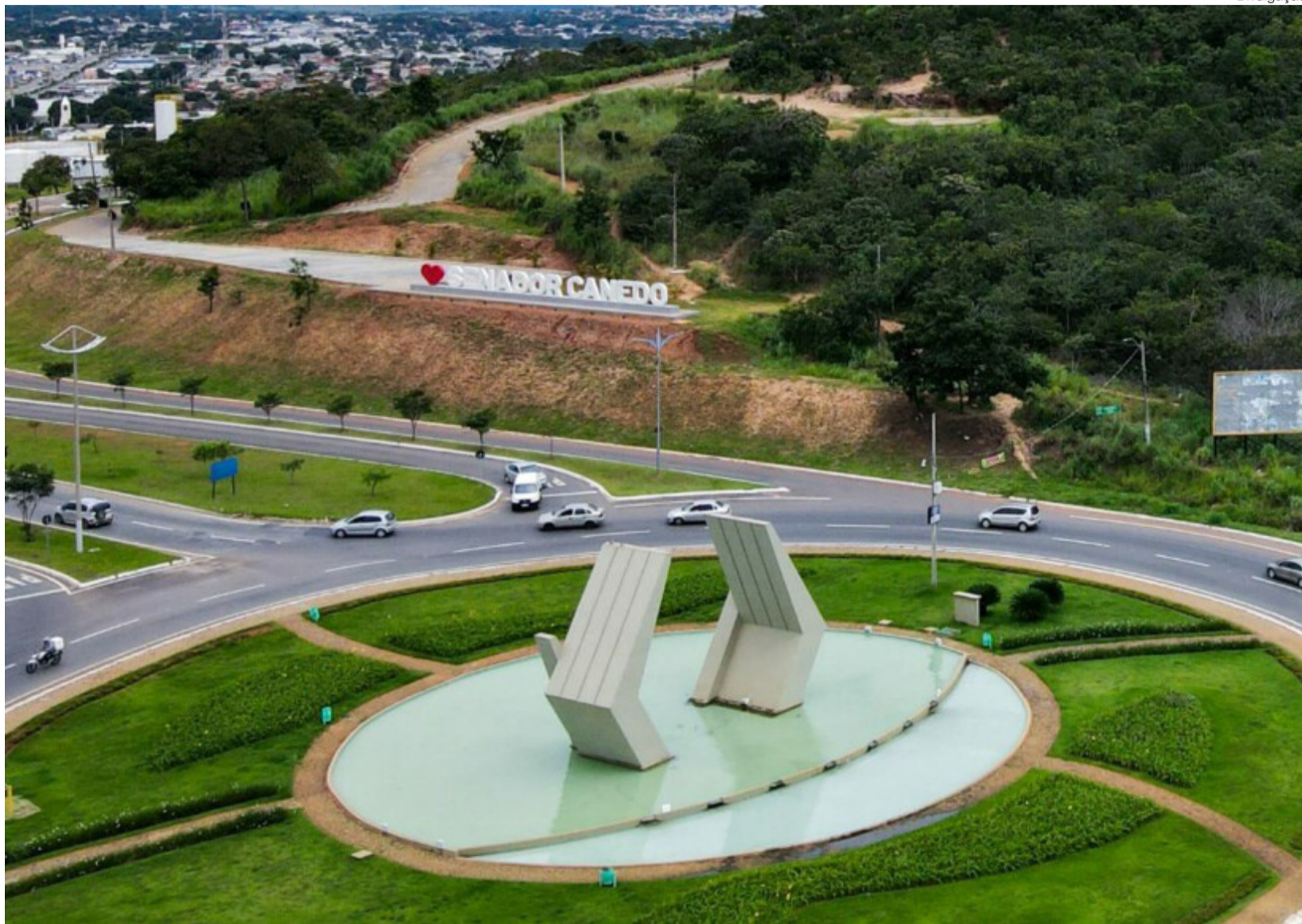
TABELA VEREADORES SENADOR CANEDO