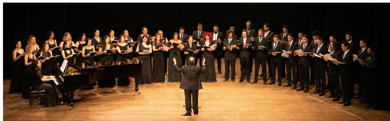
Marcello Casal JR

O público vai apreciar obras em diversos estilos: música brasileira, do repertório universal, além de obras musicais para coro. O evento terá também um telão, onde será exibida a trajetória do CSJG.