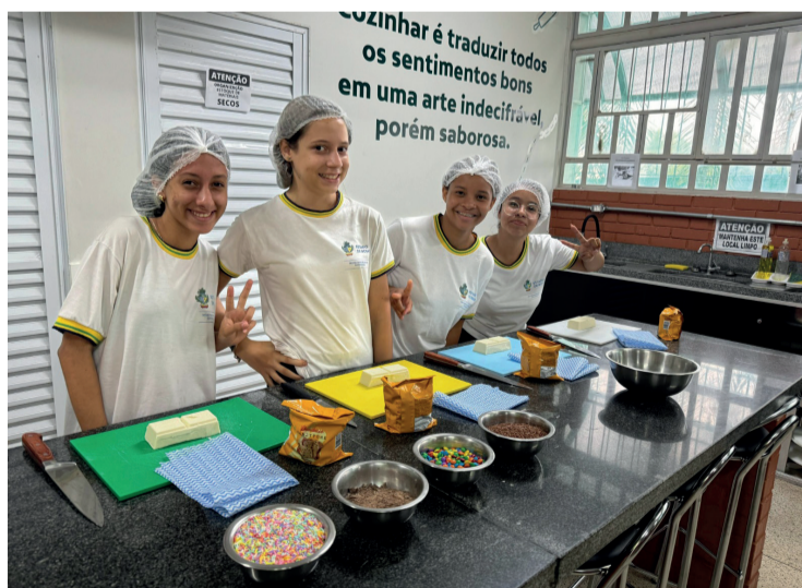
Cotec oferta cursos em áreas como gastronomia e informática

O Cotec tem unidades em 16 municípios, mas abraça todo o território goiano por também funcionar na modalidade on-line. As capacitações disponíveis abrangem várias áreas, como gastronomia, informática, saúde, estética e agronegócio. Aos alunos em situação de vulnerabilidade socioeconômica, o Estado concede o Bolsa Qualificação, benefício mensal de R$ 250 ao longo do curso. Desde que foi lançado, em 2021, até outubro deste ano, o Governo de Goiás já investiu mais de R$ 4,7 milhões no programa, emitindo 15.655 cartões.