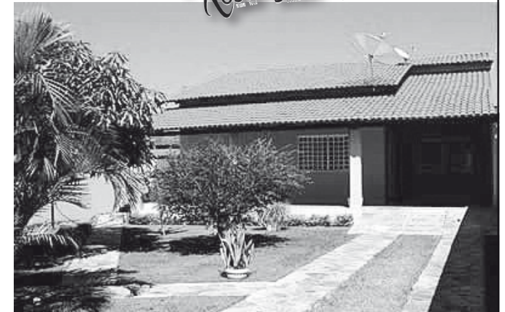
Casa Amarela está localizada no Itaguaí III