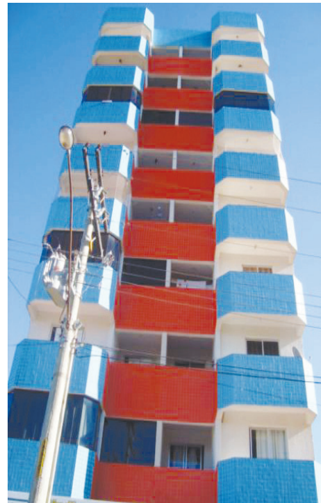
Res. Orquídeas da Serra - Venda de aptº de 02 quartos c/ suíte e garagem.

HOTEL HOLIDAY HOUSE - Em pleno funcionamento, a 500 m do trevo de Rio Quente, 24.000 m², com 10 chalés de 01 e de 02 quartos mobiliados e equipados com ar condicionado e frigobar, recepção, refeitório, área para churrasco, 02 piscinas, cozinha externa, casa sede, lavanderia, pomar completo, área gramada e ajardinada, 02 baias cavalariças. Retorno garantido de investimento.