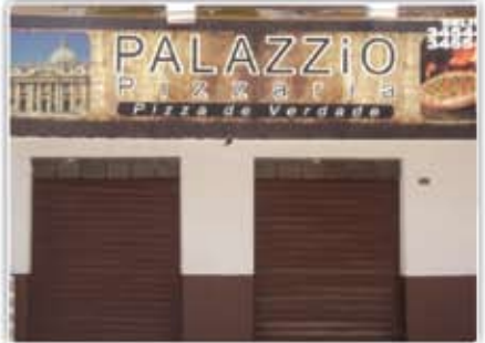
Pizzaria bem montada em uma ótima localização, situada no Centro de Caldas Novas Negócio de Ocasião.