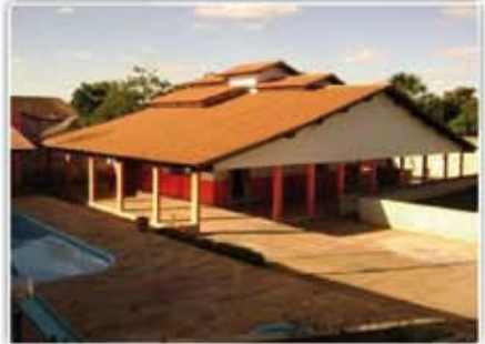
Casa em três lotes com 4/4, 2 suítes, 2 WC, sala, copa, varanda, churrasqueira, barzinho, quadra poliesportiva, campo society, piscina, cozinha, área de serviço.