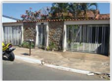
Casa no Itanhanga casa com ótima localização