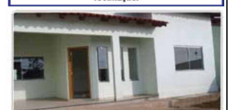
CALDAS DO OESTE: Casa com 3/4 sendo 1 suíte, 1 wc social, 1wc externo, sala de estar, copa,coz, área de serviço, dispensa, garagem e um amplo qntal. terreno com 492m² e 140m² de área construída de alto padrão com porcelanato e blindex. confira o valor!

PAINEIRAS - Apartamento de 3 quartos sendo sendo 01 suíte, 02 banheiros sociais, sala, cozinha, área de serviço e garagem, e excelente localização.