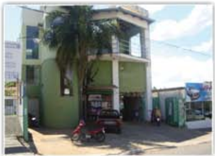
Ponto Comercial na Avenida Bento de Godoy