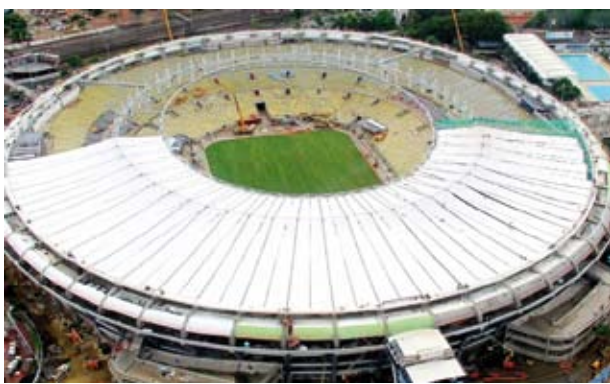
Membranas ainda serão tensionadas

A tempestade do último dia 6 gerou cenas que chocaram até a Fifa (veja no vídeo abaixo). A mais preocupante foi a presença de homens em cima do novo teto do Maracanã retirando a água com baldes e sem equipamento de segurança (os alemães, contratados para orientar