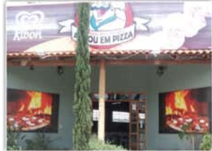
Ponto Comercial - Pizzaria e Restaurante, salão para 60 jogos de mesas, Play Ground, Buffet com 10 cubas quentes, e 14 frias, Churrasqueira na brasa etc...