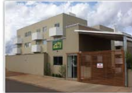
Apartamento Residencial Ilha Bella II. 2/4, guarda-roupas embutidos, estacionamento e recepção 24h.