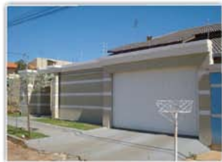
Casa - 3/4, 2 suíte, 2 WC, Sala, Copa, Coz., Área de serviços, portão eletrônico, Churrasqueira, lavanderia, acabamento de primeira e garagem para 4 carros

Sítio com Área 10 Alqueires e 400 M do asfalto. Casa 1/4, Banheiro, Área lateral, Abastecimento da Casa ( Poço Artesiano) e do Gado Nascente, a rvores Frutíferas. 21 Km do Trevo Saída para Marzagão