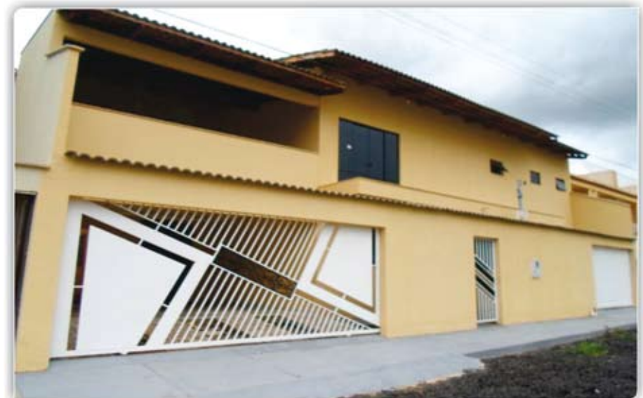
Sobrado NOVO, com 3 quartos sendo 1 suíte, sala, cozinha, banheiro social, área de serviço, varanda e garagem, situado a Rua 21 de Abril, setor Bandeirantes (Preço de Ocasão).

Casa com 3/4 sendo 1 suíte, sala, coz, WC, área de serviço e garagem R$ 500,00 ALUGUAL FILIAL 64-3453-6006 Casa com 3/4 sendo 1 suíte, sala, coz, WC social, área de serviço e garagem, setor Serrinha, R$ 500,00. Sala comercial com banheiro, sito a Av. Caldas Novas, setor Caldas do Oeste R$ 550,00. Aptos 2/4 sendo 1 suíte, sala/coz, WC, área de serviço, garagem e duas sacadas, no Cond. Residencial Mont Serrah R$ 600,00 (incluso o cond.). Sala comercial com banheiro, situada na Av. do Banco de Sangue, setor Itajá R$ 600,00. Casa com 4/4 sendo 2 suítes, sala, coz, banheiro social, área de serviço e garagem ao lado do Banco HSBC, R$ 1.200,00 (para fins comerciais).