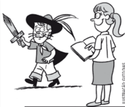
ILUSTRAÇÃO: GUTO DAS

Três professoras estão ensaiando cada qual uma peça infantil para ser apresentada na escola. As peças contarão com a participação de um número diferente de crianças. A partir das dicas abaixo, descubra o nome de cada professora, a peça infantil que cada uma está ensaiando e quantas crianças irão participar de cada apresentação.