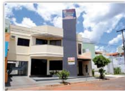
Sobrado no Setor Bandeirantes. Comercial e Residencial área livre do terreno 420 mts², área construída 450 mts² apto com 3/4 e 1 suíte com hidro.