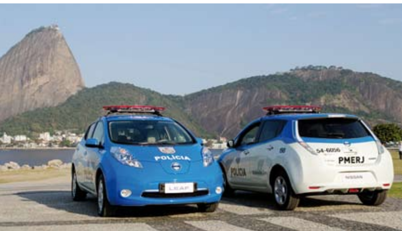
Frotas policiais usam elétrico Leaf. Página 2.

DIÁRIO - R$ 0,50 - Ano 8 - Número - 1.994 - Sexta-Feira, 23/08/2013.