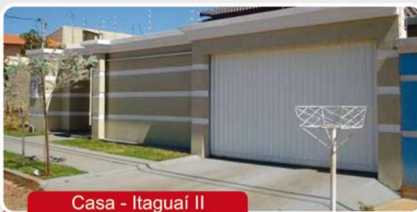
Casa - Itaguaí II

Casa - 3/4 sendo 2 suíte, 2 WC, Sala, Copa, Cozinha, Área de serviços, portão eletrônico, Churrasqueira, lavanderia, acabamento de primeira e garagem para 4 carros.