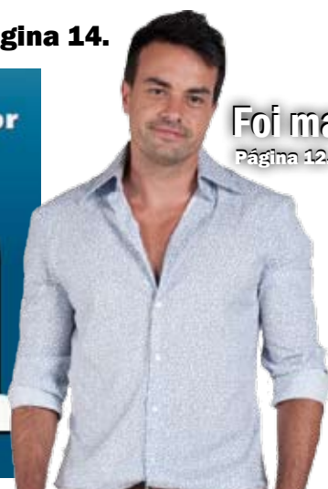
Foi mal Página 12.