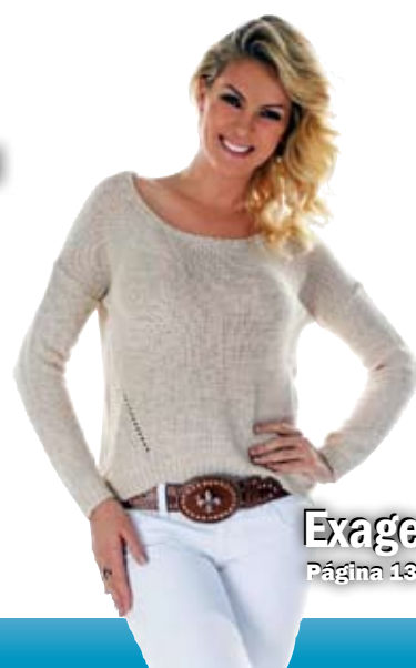
Exagero? Página 13.

DIÁRIO - R$ 0,50 - Ano 8 - Número - 1.997 - Terça-Feira, 27/08/2013.