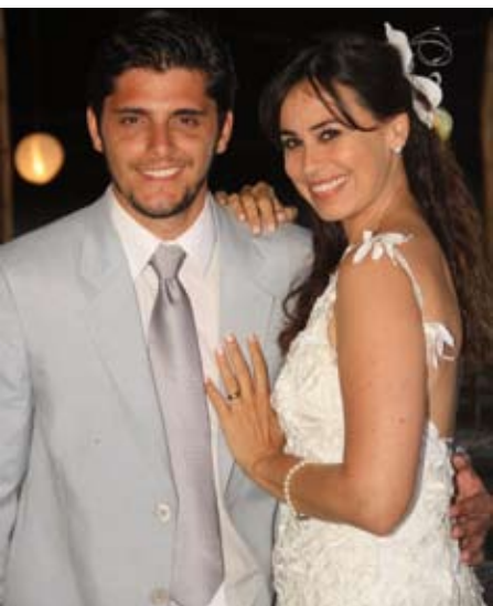
Canal ZAP Final feliz

DIÁRIO - R$ 0,50 - Ano 8 - Número - 1.997 - Terça-Feira, 27/08/2013.