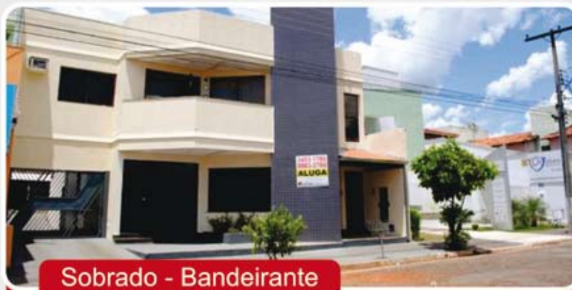
Sobrado - Bandeirante

Excelente Sobrado Comercial e Residencial - área livre do terreno 420m². Área construída aproximadamente 450m². Sala de TV, ampla cozinha com armários, armários em todos os quartos, área para garagem ou ampliação.