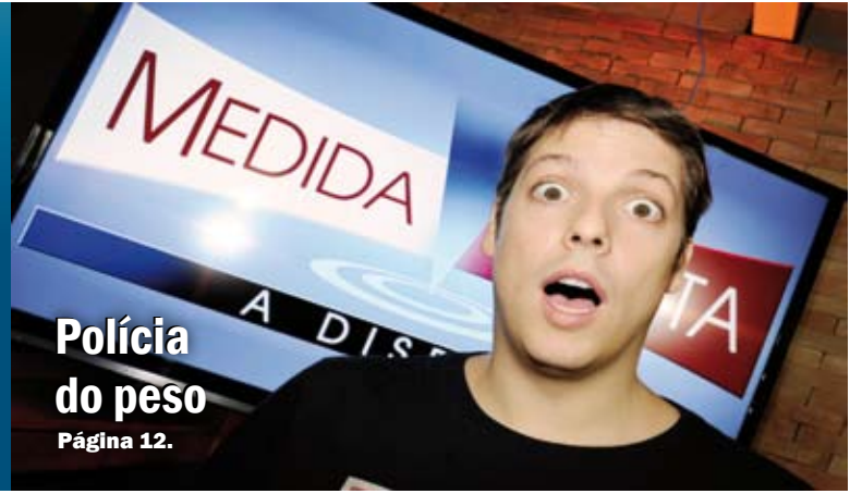
Polícia do peso Página 12.

DIÁRIO - R$ 0,50 - Ano 8 - Número - 1.999 - Quinta-Feira, 29/08/2013.