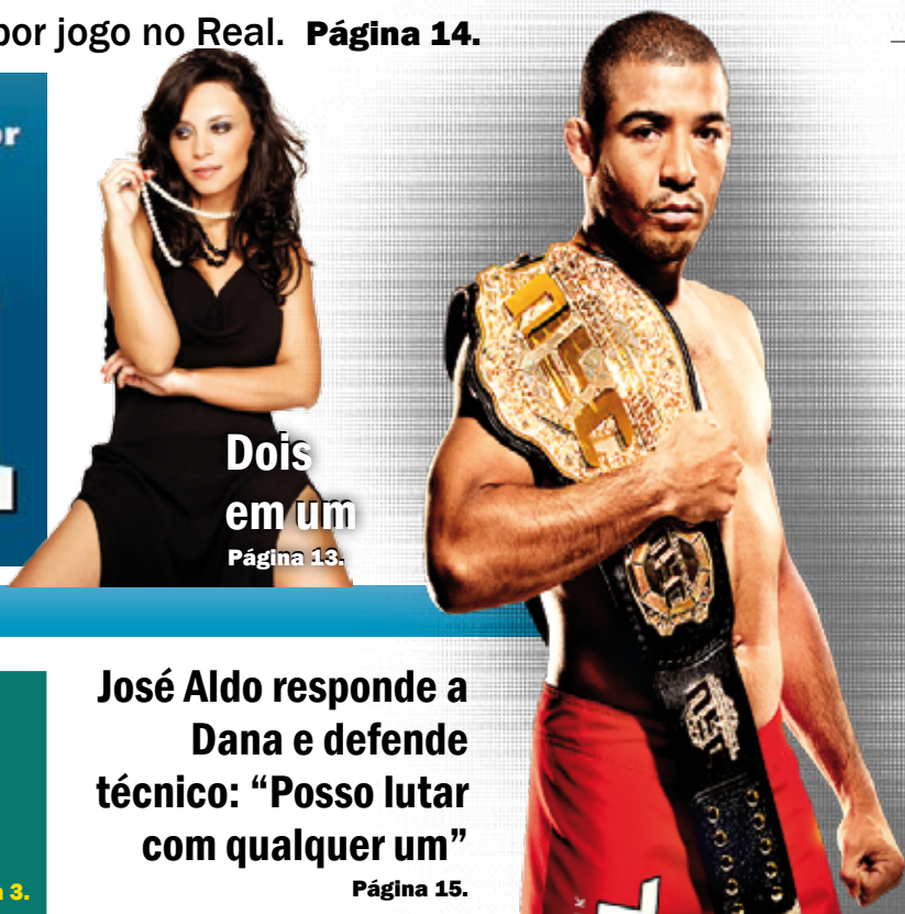
Dois em um Página 13.

DIÁRIO - R$ 0,50 - Ano 8 - Número - 2.003 - Terça-Feira, 03/09/2013.