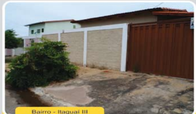
Bairro - Itaguaí III

Casa de 3/4 sendo 01 suíte, 01 banheiro social, sala, cozinha, área de serviço, varanda, dispensa, garagem e um amplo quintal. Ótima localização! R$ 130 mil oportunidade única.