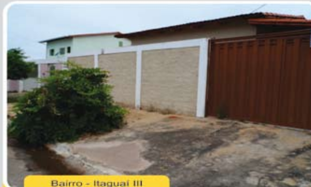
Bairro - Itaguaí III

Casa de 3/4 sendo 01 suíte, 01 banheiro social, sala, cozinha, área de serviço, varanda, dispensa, garagem e um amplo quintal. Ótima localização! R$ 130 mil oportunidade única.