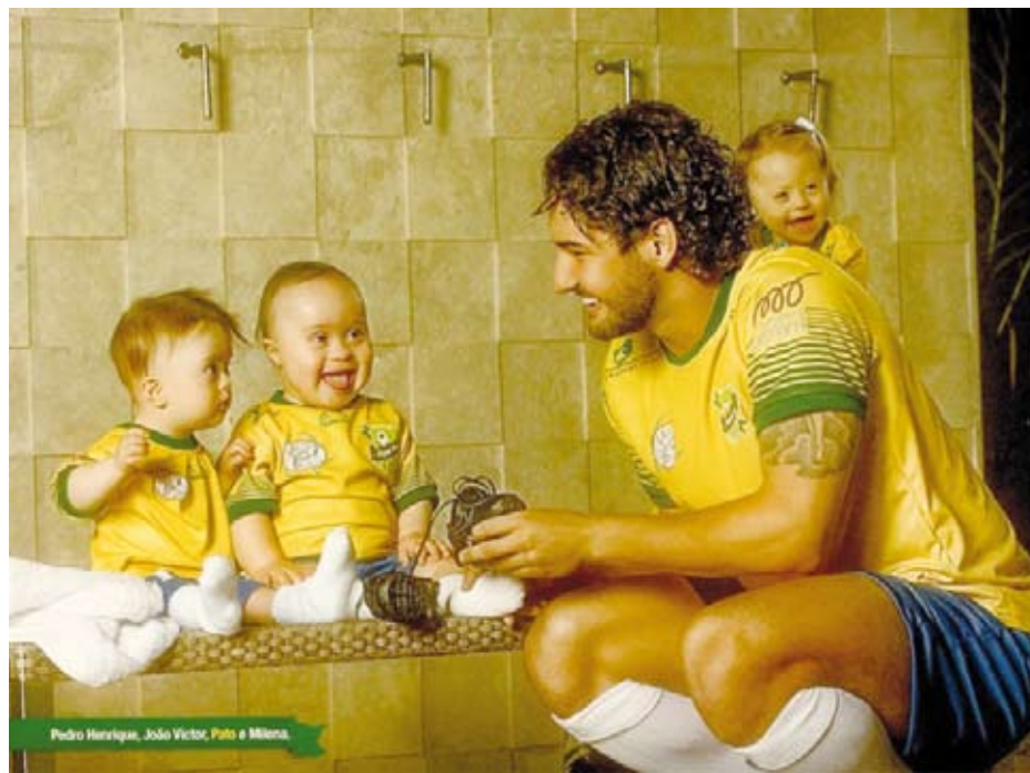
Foto Legenda. Ser diferente é normal. Página 2.