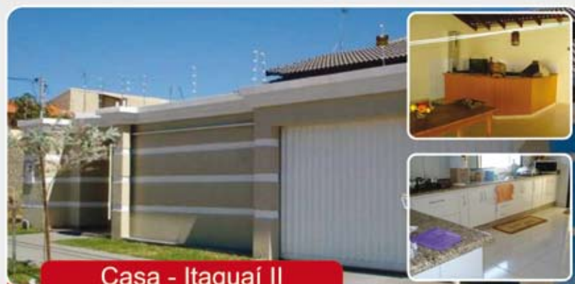
Casa - Itaguaí II

Casa - 3/4 sendo 2 suíte, 2 WC, Sala, Copa, Cozinha, Área de serviços, portão eletrônico, Churrasqueira, lavanderia, acabamento de primeira e garagem para 4 carros.