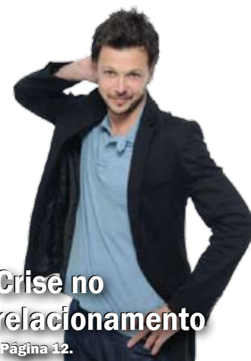
Crise no relacionamento Página 12.

DIÁRIO - R$ 0,50 - Ano 8 - Número - 2.075 - Sexta-Feira, 13/12/2013.