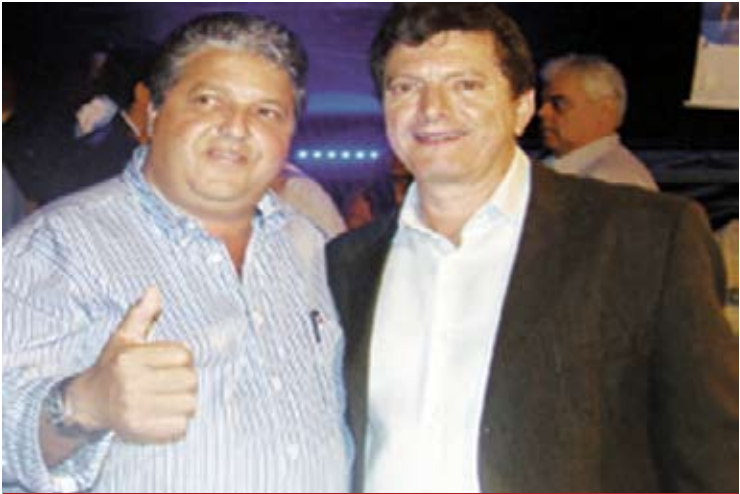
Itumbiara. 13º Salários e férias dos servidores. Página 4.