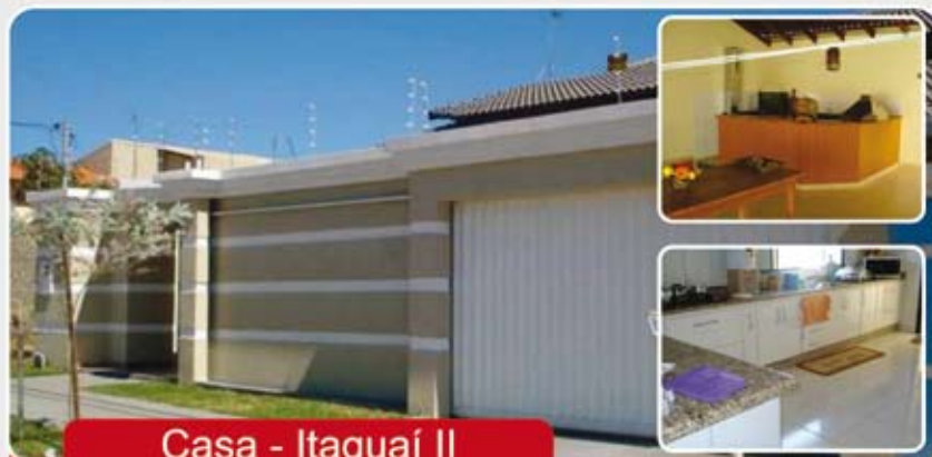
Casa - Itaguaí II

Casa - 3/4 sendo 2 suíte, 2 WC, Sala, Copa, Cozinha, Área de serviços, portão eletrônico, Churrasqueira, lavanderia, acabamento de primeira e garagem para 4 carros.