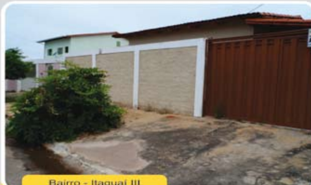
Bairro - Itaguaí III

Casa de 3/4 sendo 01 suíte, 01 banheiro social, sala, cozinha, área de serviço, varanda, dispensa, garagem e um amplo quintal. Ótima localização! R$ 130 mil oportunidade única.