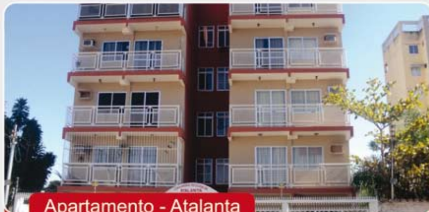
Apartamento - Atalanta

Apartamento - Cobertura, duplex 3 quartos, sendo 2 suítes, 4 banheiros, 2 salas, cozinha, área de serviço, sauna, deck, localizado no centro de Caldas Novas.