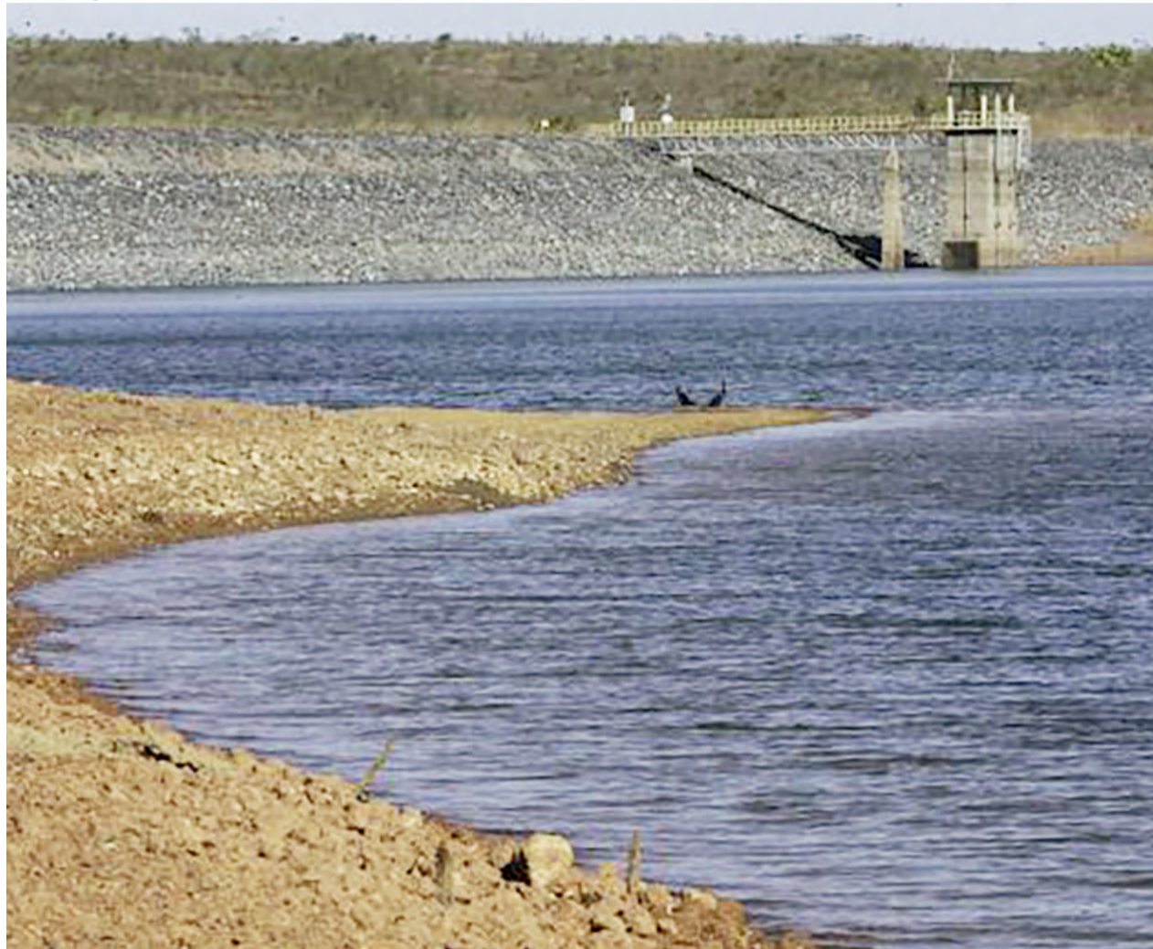
Brasília - O reservatório de Santa Maria atingiu a marca de 25,2%

Atualmente, o rodízio é feito de seis em seis dias, com interrupção de 24 horas no abastecimento, em áreas definidas pela Caesb