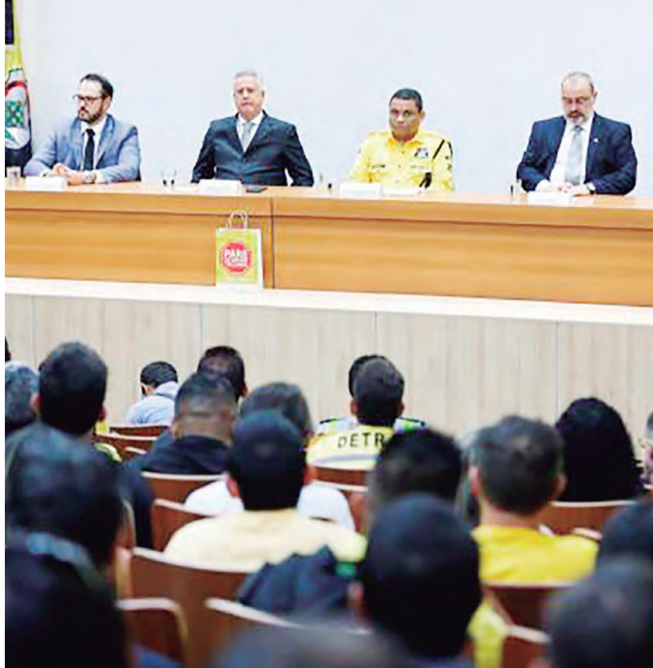
Lançamento da versão eletrônica da CNH digital no Distrito Federal

A CNH eletrônica substitui a impressa, uma vez que ambas têm o mesmo valor jurídico. A versão digital do documento valerá para todo o território nacional