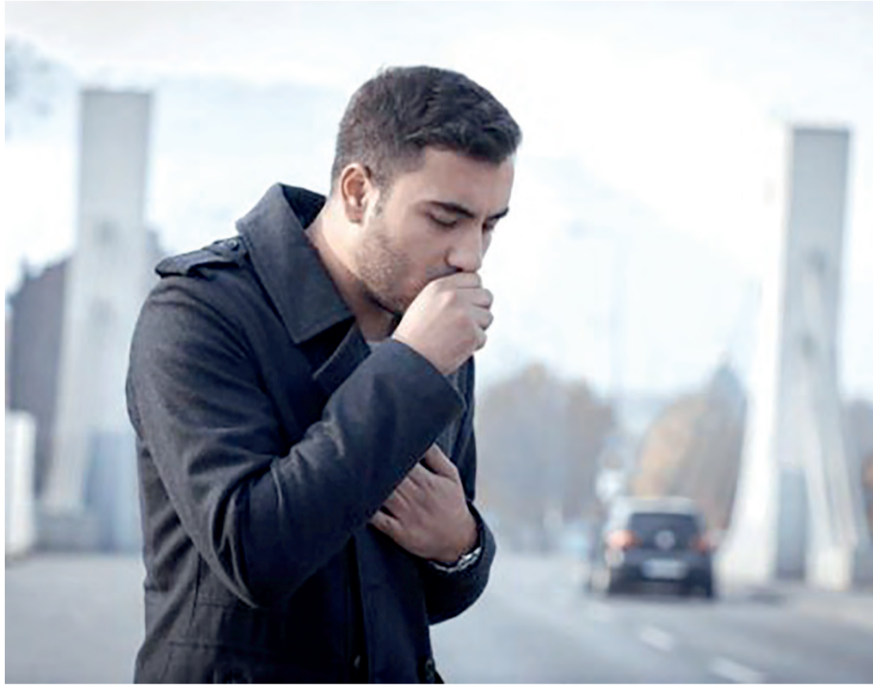
Um dos grandes problemas da Dpoc é que nem sempre ela é diagnosticada; a tosse pode ser um dos sinais de alerta

Se você é fumante habitual, tem 90% de chance de sofrer de Doença Pulmonar Obstrutiva Crônica (Dpoc), segundo a Organização Mundial de Saúde (OMS)