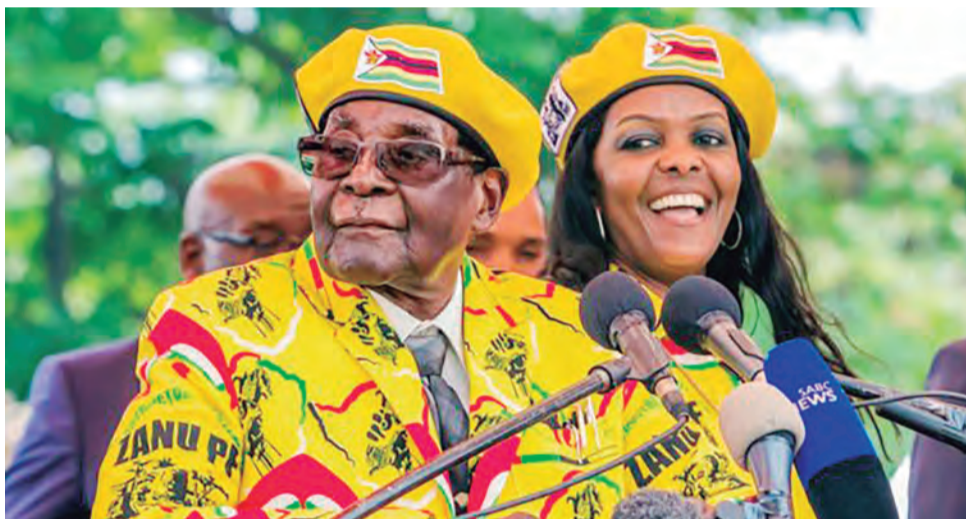
Robert Mugabe apoiava a mulher em suas ambições políticas