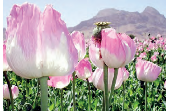
Plantações de papoula ocupam mais de 300 mil hectares no Afeganistão, o maior cultivo do mundo

A consequência desse aumento de produção no Afeganistão é global. Segundo o Unodc, uma heroína mais barata deve chegar aos consumidores ao redor do mundo.