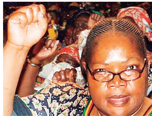
Joice Mujuru também foi afastada da vice-presidência do Zimbábue após sofrer ataques da primeira-dama

ambições. Em 2014, disparou: “Dizem que quero ser a presidente. Por que não? Não sou uma zimbabuana?”.