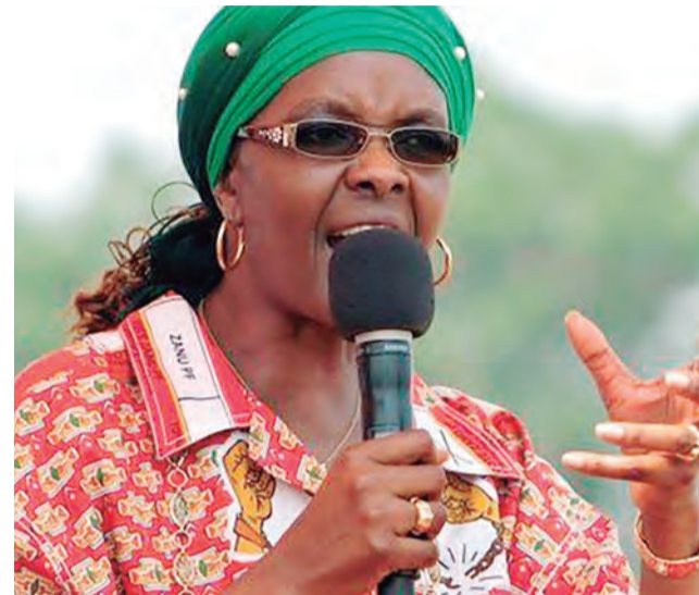
A primeira-dama é famosa por seus ataques a adversários políticos

Em meio às dúvidas sobre o estado de saúde de Mugabe, que é o presidente mais velho do mundo, as investidas dela contra Mnangagwa foram interpretadas como uma tentativa de se posicionar como a sucessora do marido. E ela nunca escondeu suas