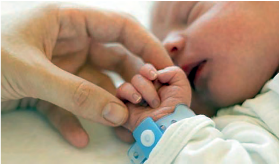
Inseminação caseira é um dos principais métodos para concepção entre quem opta pela coparentalidade