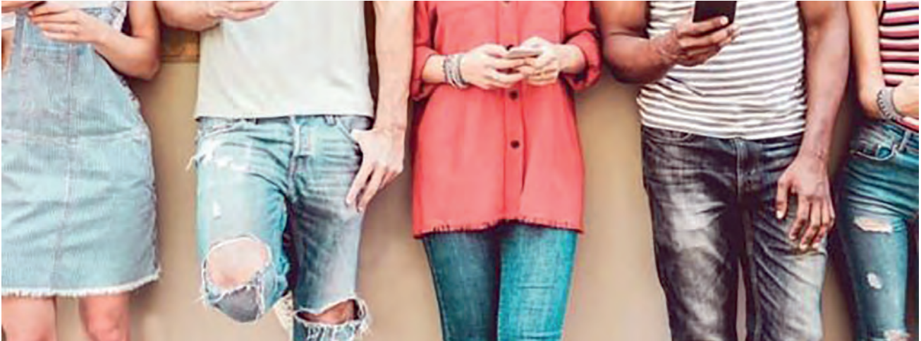
Nos EUA, há vários sites para quem quer buscar parceiros para ter filhodesem vínculo amoroso