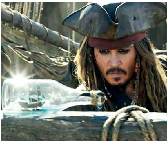
Disney começa a pensar em “Piratas do Caribe 6”, mas fator Johnny Depp pode atrapalhar