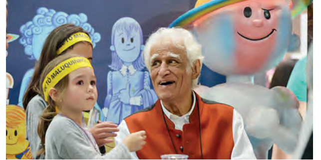
O escritor Ziraldo em tarde de autógrafos na 25ª Bienal Internacional do Livro de São Paulo, no Anhembi

tudo, botar outra roupa, lavar a cara, fazer cabelo.” Para a atriz, aquele foi “um momento de comunhão de atores e de intenção cênica”.