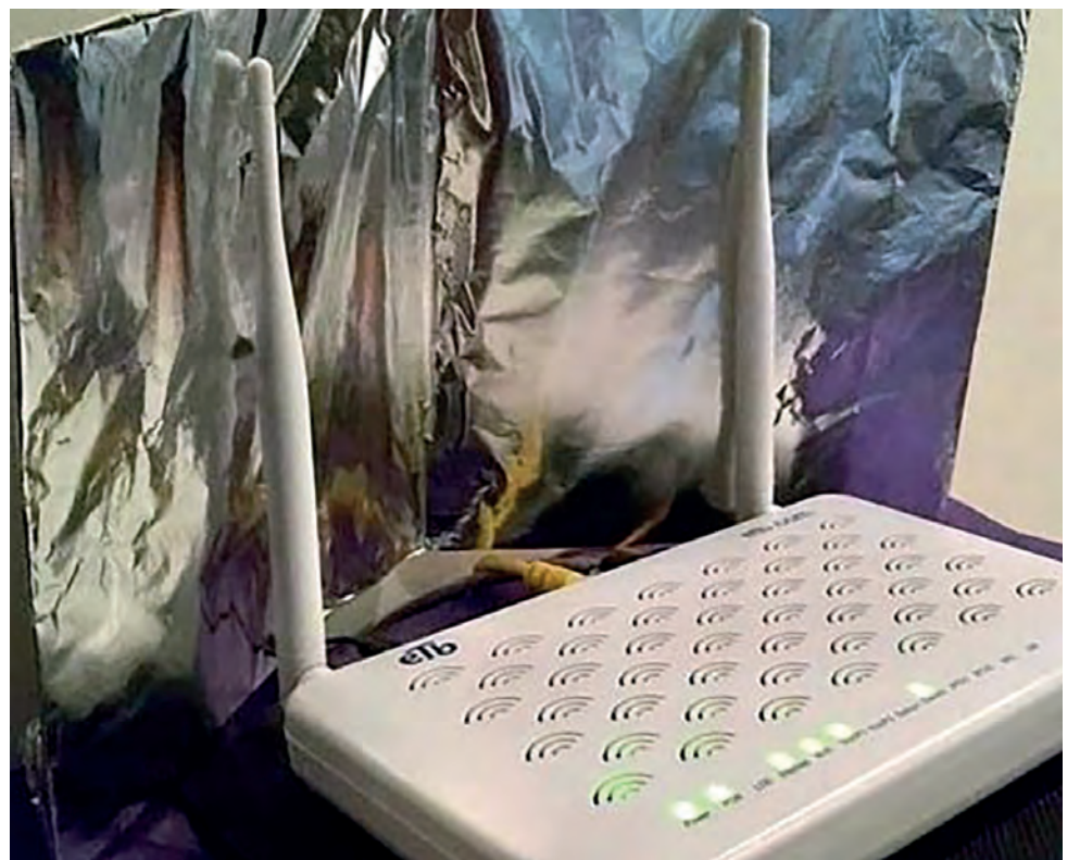
Uma barreira de papel alumínio ajuda a direcionar o sinal de internet sem fio

Graças à nossa luta diária para ter um bom wi-fi em casa, ficou famosa a ideia de usar papel alumínio para direcionar o sinal de internet. Não é um truque novo, mas é bom saber que a ciência demonstrou que ele funciona.