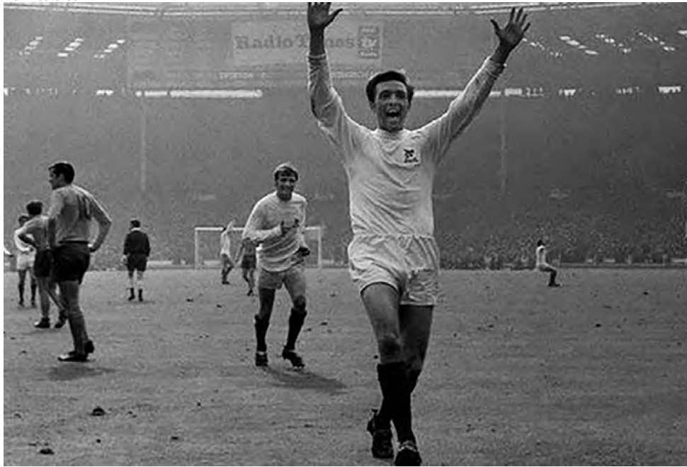
Uma investigação da morte do jogador Jeff Astle apontou que ela se deveu a uma lesão cerebral

ria ser banido, mas defende que a Associação de Jogadores de Futebol Profissionais (PFA, na sigla em inglês) e a Associação de Futebol, duas das principais entidades do esporte na Inglaterra, deveriam fazer mais para apoiar ex-jogadores