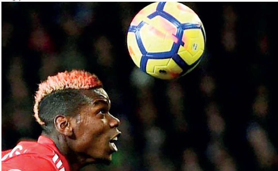
Cabecear é ‘perigoso’ e ‘não faz sentido’, diz um dos maiores especialistas em lesões cerebrais

entre elas. Crianças com 12 a 18 anos poderiam jogar, mas não deveriam cabecear”, disse.