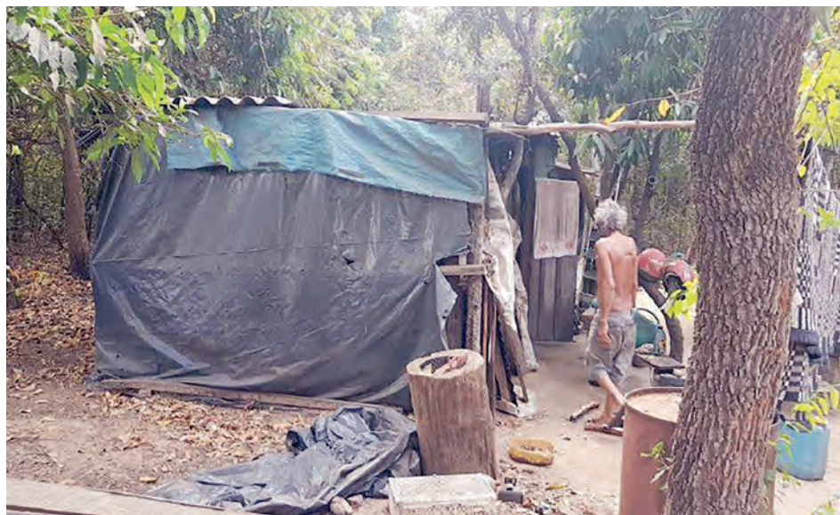
Alojamentos do trabalhador resgatado de carvoaria em Serranópolis

Por fim, o pagamento de salário era irregular e não havia assinatura da Carteira de Trabalho e Previdência Social. O contrato foi encerrado e as verbas rescisórias do trabalhador, em torno de R$9 mil, acertadas.