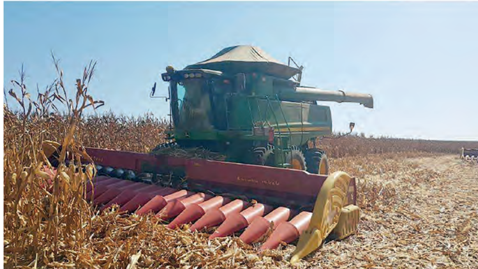
Máquina usada na colheita do milho por trabalhadores, que chegavam a laborar por até 15hs/dia