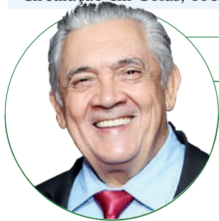
■ HD Hércules Dias www.herculesdias.com.br