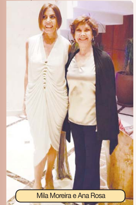
Mila Moreira e Ana Rosa