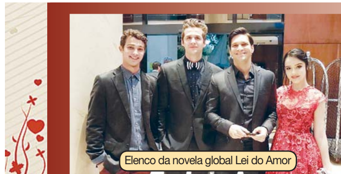
Elenco da novela global Lei do Amor