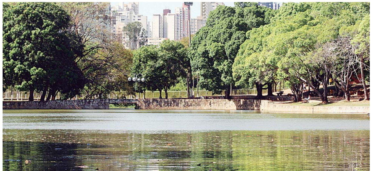
Vista do Lago das Rosas, onde existem nascentes do Córrego Capim Puba

Amma e Prefeitura proibidas de lançar esgoto das jaulas do zoológico no Córrego Capim Puba