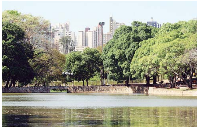
Vista do Lago das Rosas, onde existem nascentes do Córrego Capim Puba

A decisão obriga ainda os réus a elaborarem, no prazo de 180 dias, projeto técnico para a implantação de sistema de tratamento de efluentes dos tanques dos hipopótamos e das antas, bem como dos demais