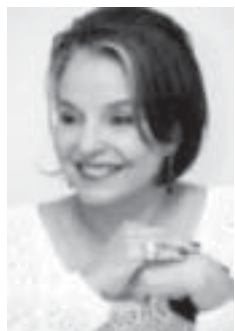
Iris Araújo Senadora da República

Hoje não há quem questione o fato de que a entrada feminina no centro das decisões é capaz de mudar a forma de fazer política. Os números ainda não mudaram o bastante e estão longe disso! Mas o modelo machista de fazer política é arranhado toda vez que uma mulher, transformada em agente público, age segundo as suas próprias características femininas. Um bom exemplo? Há algum tempo, sempre que ela chegava ao poder por ser de tradicional família de políticos, a conclusão era rápida: "só conseguiu por causa do pai, ou do marido". Hoje, entre estas herdeiras, várias já conseguiram tomar rumos independentes, e algumas até já superaram o prestígio de seus parentes.