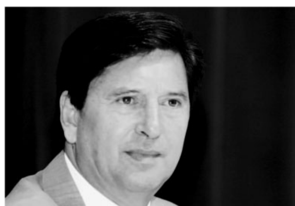
Frenesi no PMDB goiano

"Esperamos a aprovação da diretoria administrativa da estatal e do governo. Caso haja uma resposta positiva dessas instâncias, o Estado de Goiás será contemplado", garante o diretor de Gás e Energia da Petrobras, Ildo Sauer. ■