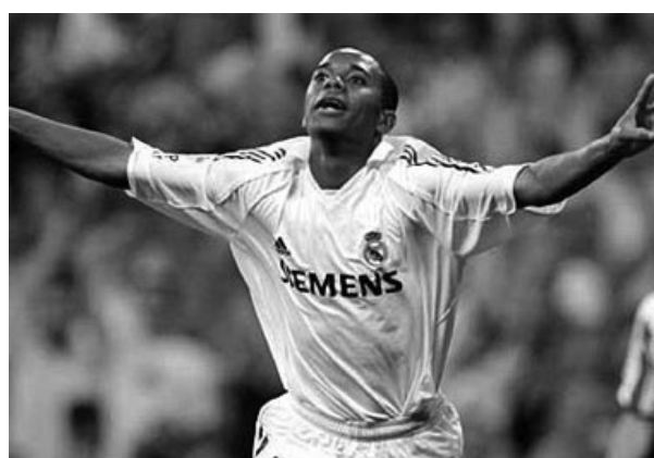
Revelação brasileira do século 21