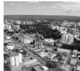
Este espaço pode ser seu!

Anuncie seu produto ou serviço e ganhe um mundo de vantagens