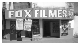
Rua 01 Qd. 15 Lt. 01 Itaici 1

A FOX agradece a você cliente, que nos prestigia diariamente com sua ilustre presença e convida você que ainda não teve a oportunidade de vir degustar o mais saboroso churrasquinho da cidade, além da cerveja mais gelada, uma enorme variedade de porções e um atendimento cordial com um preço justo.