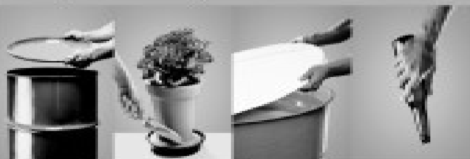
Verifique sempre a tampa e o líquido