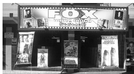
Av. B Qd 37 Lt. 13 sl. 01 Nova Vila - Fone: (64) 3454-4630