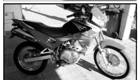
Honda Falcon 400 cilindradas ano 2005 vermelha único dono, documentação em dia tratar 9994-4092