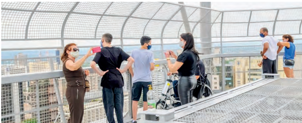
A Torre de TV encanta os turistas que antes ou depois de subir visitam a feira de artesanato