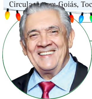
■ HD Hércules Dias www.herculesdias.com.br