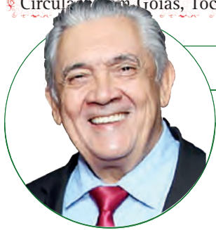
HD Hércules Dias www.herculesdias.com.br