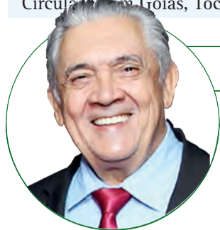
■ HD Hércules Dias www.herculesdias.com.br