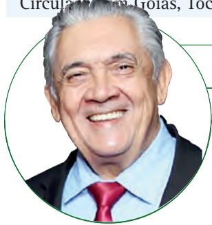
■ HD Hércules Dias www.herculesdias.com.br