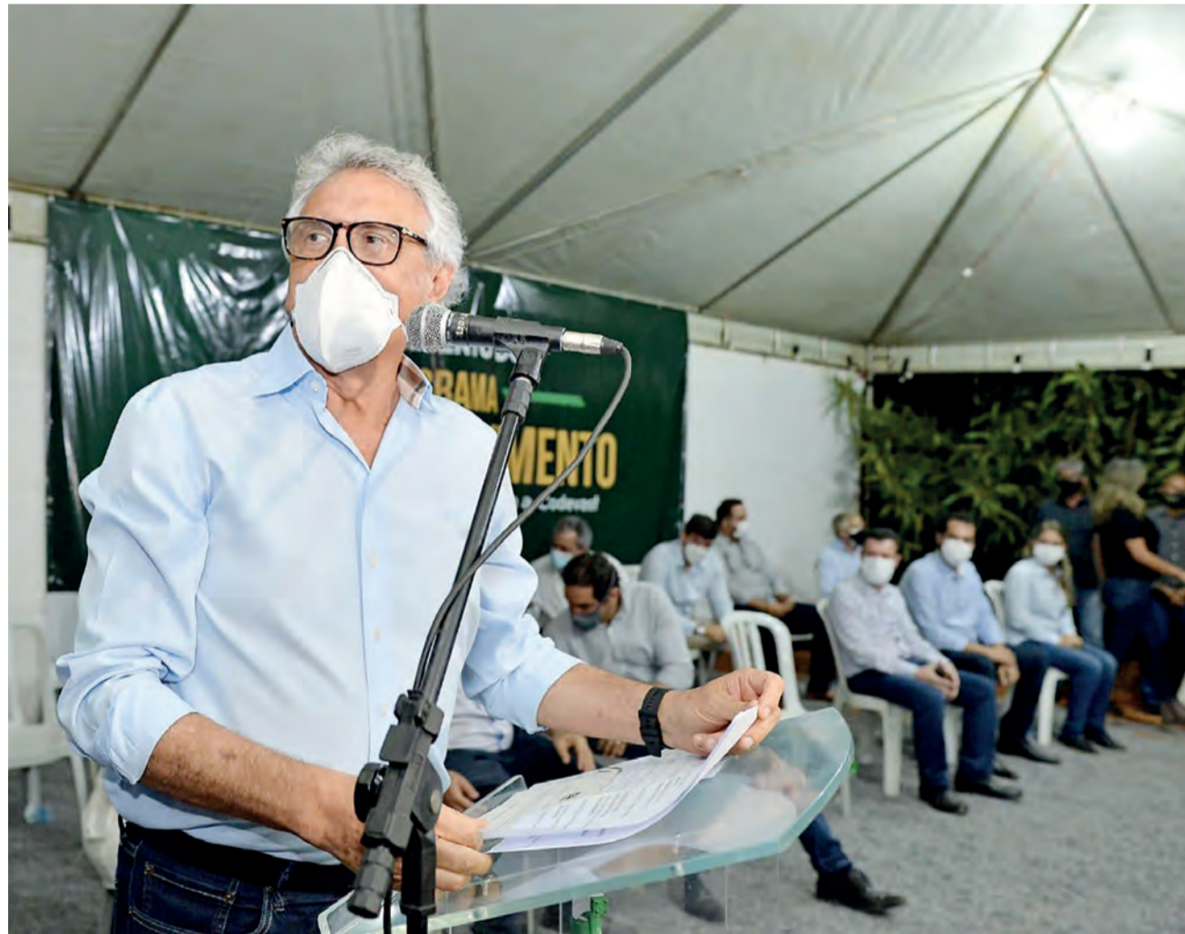
Governador Ronaldo Caiado lança programa Goiás em Movimento-Eixo Pontes, na GO-116, sobre o Rio Taperão, em Formosa, região do Entorno do Distrito Federal: até 2022, serão construídas 180 estruturas viárias em todo Estado