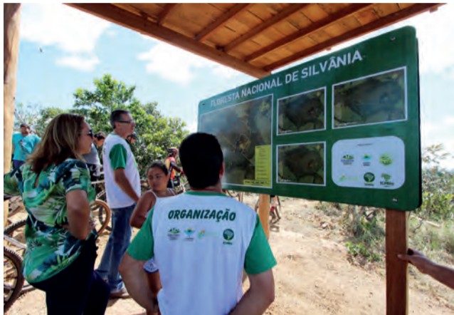
Flona de Silvânia conta com sinalização e estrutura para acolhimento de visitantes

TÚLIO MOREIRA - Um verdadeiro tesouro muito perto de Goiânia ainda permanece desconhecido para a maior parte da população. A Floresta Nacional (Flona) de Silvânia, localizada a apenas 73 quilômetros da capital, é um dos principais santuários de preservação e visitação do bioma cerrado, sendo uma das duas áreas de preservação em Goiás elevadas à categoria de Floresta Nacional (a outra a Flona de Mata Grande, no município de São Domingos, região norte do estado). Atualmente sob gestão do Instituto Chico Mendes de Conservação da Biodiversidade (ICMBio), e está aberta à visitação agendada.