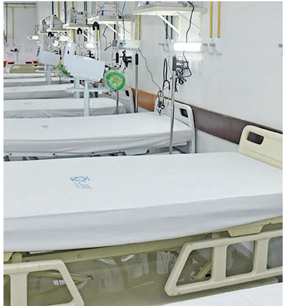
Mais 40 novos leitos de Uti estão em fase de instalação nas regiões Sul e Vale do Araguaia

Em um ano, o Governo do Tocantins ampliou em 248% o número de leitos exclusivos para tratamento da Covid-19, evidenciando a preparação da rede de assistência de saúde para o enfrentamento à pandemia do novo Coronavírus. Conforme dados do Relatório Situacional do 1º quadrimestre deste ano, entre abril de 2020 e abril de 2021, o Estado viabilizou a implantação de 567 leitos exclusivos, sendo 213 de Unidade de Terapia Intensiva (UTI Adulto).