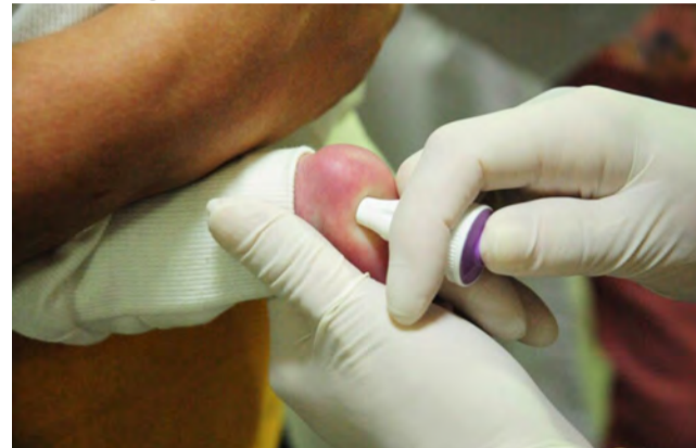
Breno Esaki / Agência Saúde DF

AG. BRASÍLIA - Por meio da Lei nº14.154, sancionada no último dia 26 de maio, o Teste do Pezinho oferecido pelo Sistema Único de Saúde (SUS) ampliará para 53 o número de doenças rastreadas pelo exame. Atualmente, o teste engloba apenas seis doenças. No entanto, o Distrito Federal é a única unidade da federação que desde 2011 já possui o Teste do Pezinho ampliado e que detecta 40 doenças.