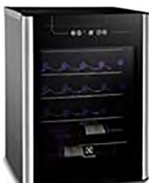
Adega de Vinhos Electrolux para 24 Garrafas, R$ 2.599,00

Com a solução UltraFast, rede de varejo premium ajuda quem deixou para comprar o presente em cima da hora