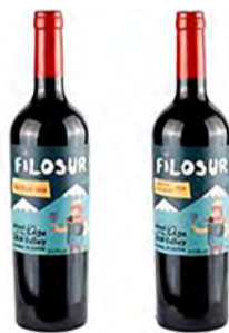
Vinho Tinto Filosur Malbec 2020 + Vinho Tinto Filosur Cabernet Sauvignon 2020, R$146,10

Samsung Galaxy S21 128GB + Galaxy Buds Pro* + Galaxy A31 Preto 128GB