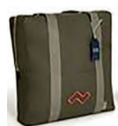
Kit com 02 Travesseiros Modulares Zissou, R$ 1.008,90