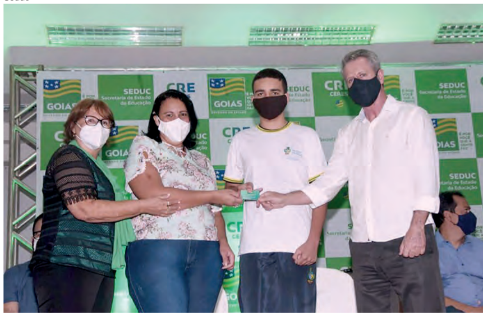
Alunos da rede pública estadual que moram em Ceres e Rialma receberam cartão alimentação nesta quinta (9). Mais de 2.700 estudantes dos municípios estão sendo beneficiados

R$ 510 mil. Outros R$ 2,5 milhões foram repassados às escolas estaduais dos municípios, desde o final do ano passado, para obras, reformas e compra de equipamentos.