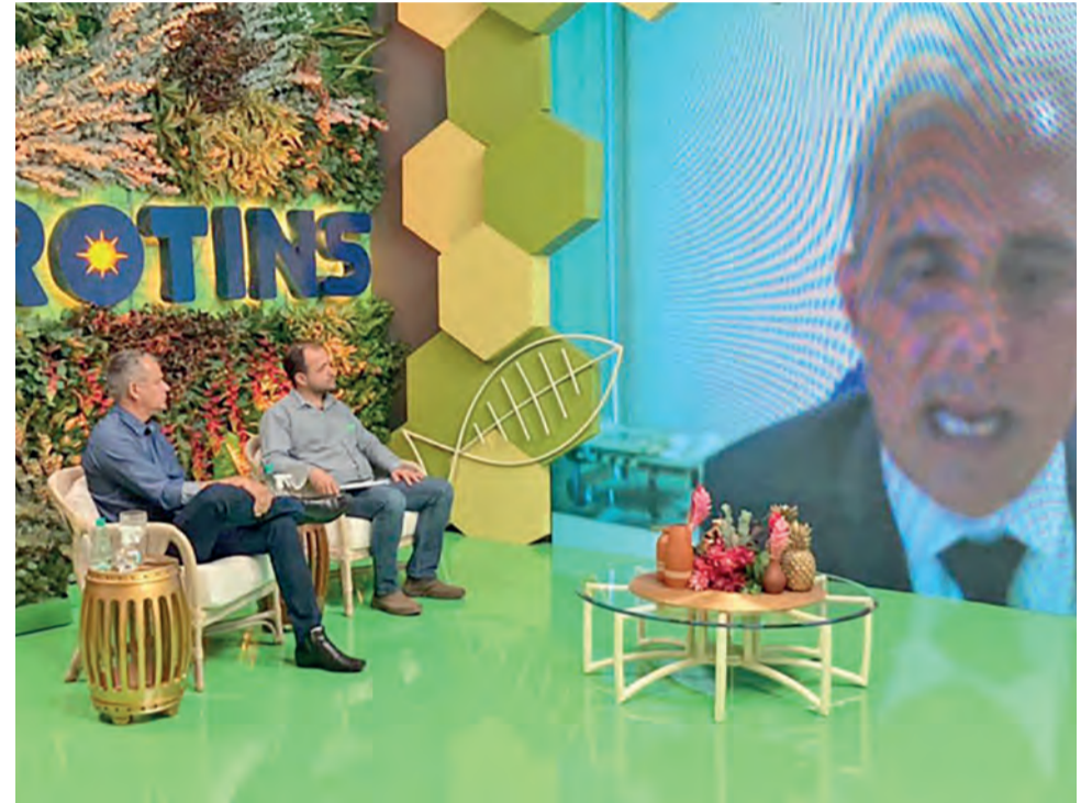
Mapa apresenta mudanças no Programa Nacional de Crédito Fundiário

LÚCIA BRITO/GOVERNO DO TOCANTINS - O Ministério da Agricultura, Pecuária e Abastecimento (Mapa) mostrou as mudanças ocorridas no Terra Brasil - Programa Nacional de Crédito Fundiário (PNCF), na manhã desta quinta-feira, 17, na programação da Feira Agrotecnológica do Tocantins - Agrotins 100% Digital.