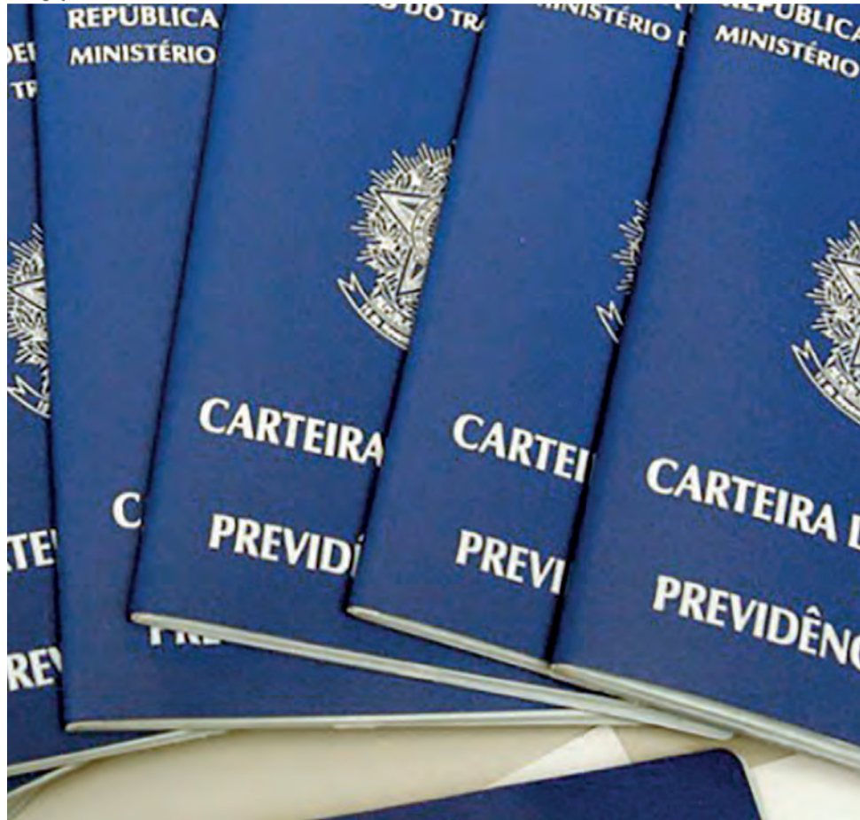
O setor de serviços foi o que mais sofreu durante os meses mais severos da pandemia da Covid-19, abril e maio de 2020, quando apresentou retração de 17% e 19,5%, respectivamente