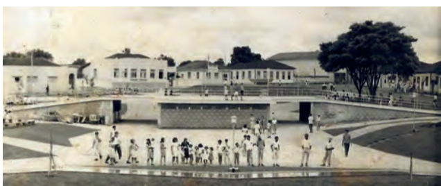
Registro de visitação na Praça do Rosário, então recém-inaugurada, na década de 60. Local é um dos símbolos da cidade