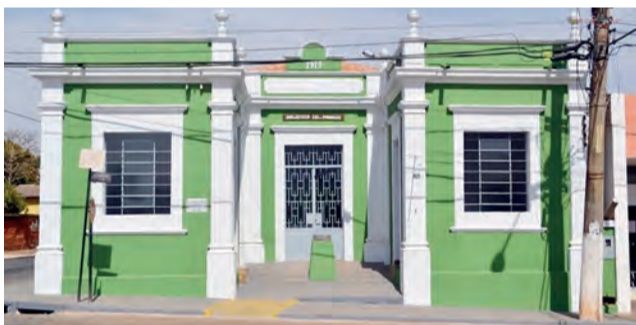
O prédio que atualmente sedia a Casa da Cultura já foi palco de muitos eventos importantes da cidade

possível capital do Estado é um motivo de orgulho para todos os moradores.