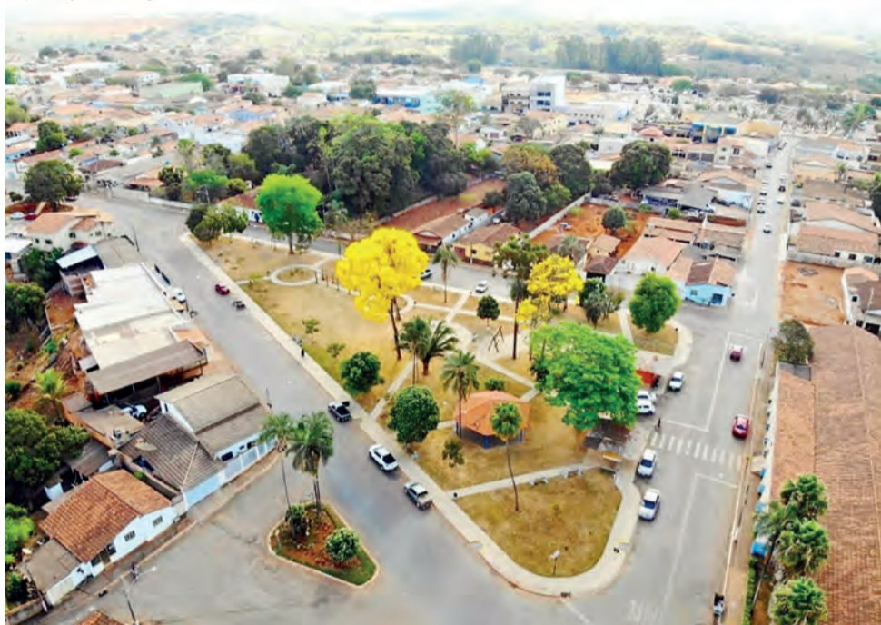
Registro da Praça Rui Barbosa pelo alto, com o belo ipê amarelo se destacando na paisagem