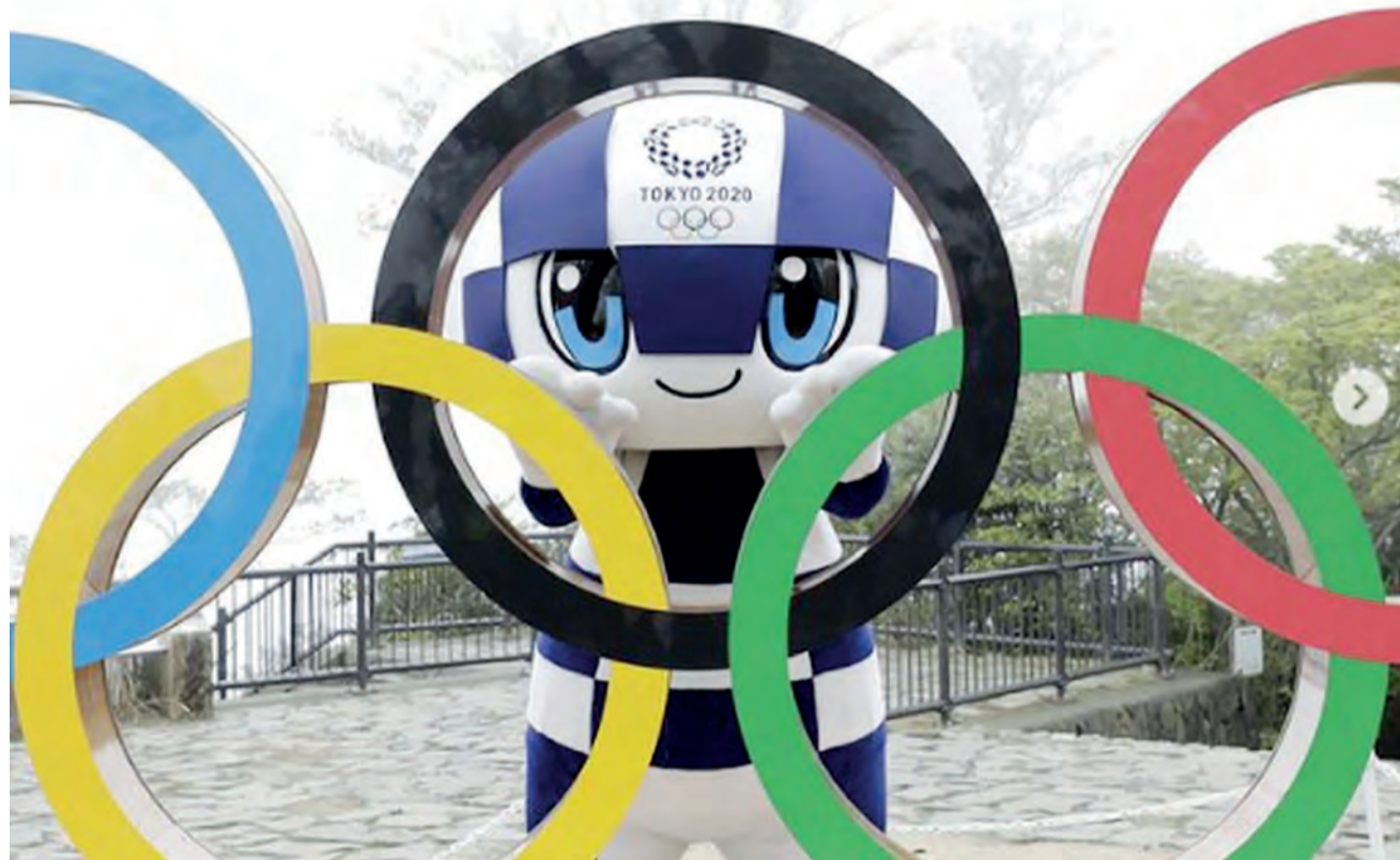
Miraitowa, o mascote dos Jogos Olímpicos de Tóquio, cuja realização enfrenta forte resistência local