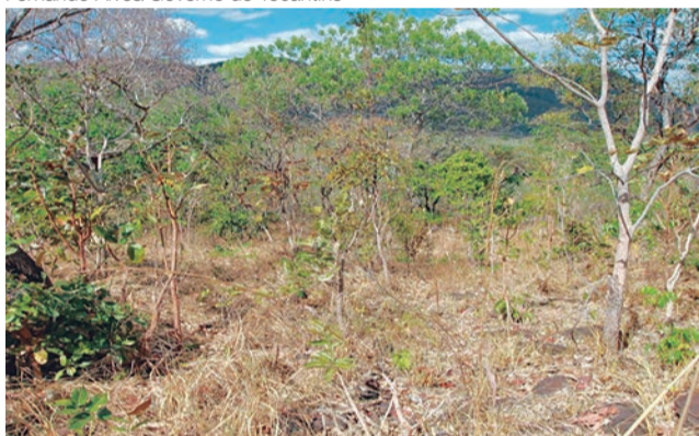
Tocantins é o único estado da Região Norte do país que está incluído no programa Monitor de Secas