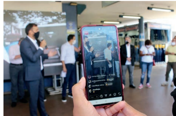
O 'Wi-Fi Social DF' foi lançado em 2019 para promover a inclusão digital da população do DF; 55 pontos foram entregues e o projeto já contabilizou mais de 70 milhões de acessos