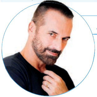
■ Carlos Arruza