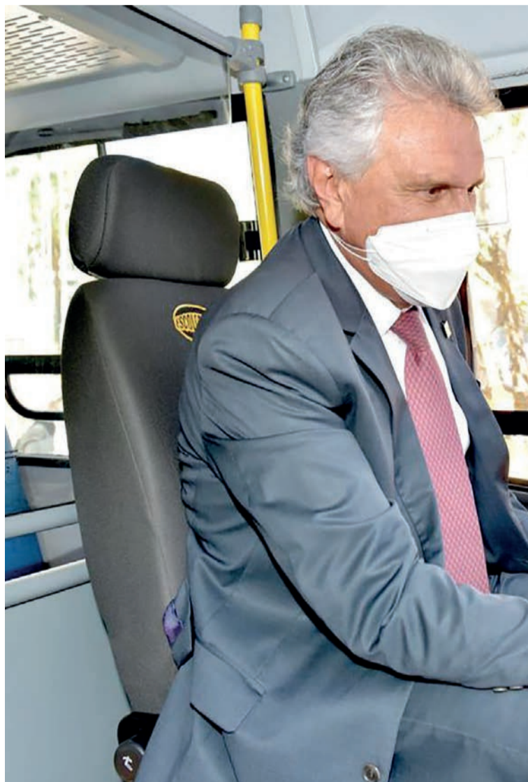
Caiado entrega 210 ônibus escolares para 125 prefeituras municipais

Investimentos somam R$ 42,7 milhões, resultado de emendas parlamentares da bancada goiana no Congresso Nacional. Nova frota beneficia 6 mil estudantes. “Lutamos, com todas as forças, para garantir educação de qualidade, que motive nossas crianças e jovens”, diz governador