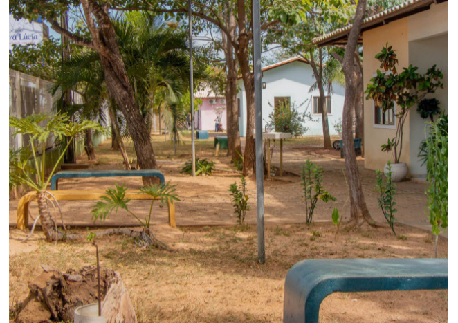
Área de convivência social da Casa de Apoio