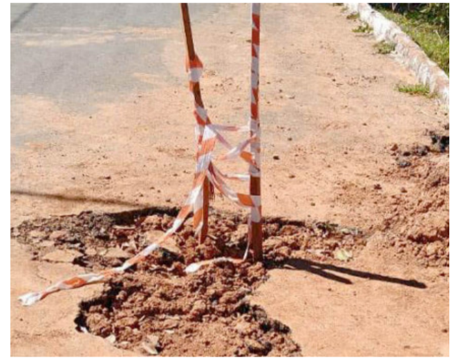
Asfaltos e calçadas são quebradas durante manutenção da rede de água e esgoto

O Procon Tocantins notificou a BRK Ambiental após denúncias de consumidores sobre a ausência da restauração de ruas e calçadas nos municípios de Dianópolis e Taguatinga.