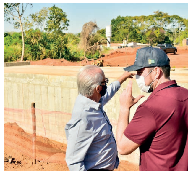
Visita ao Bueiro Celular Duplo Buriti Sereno