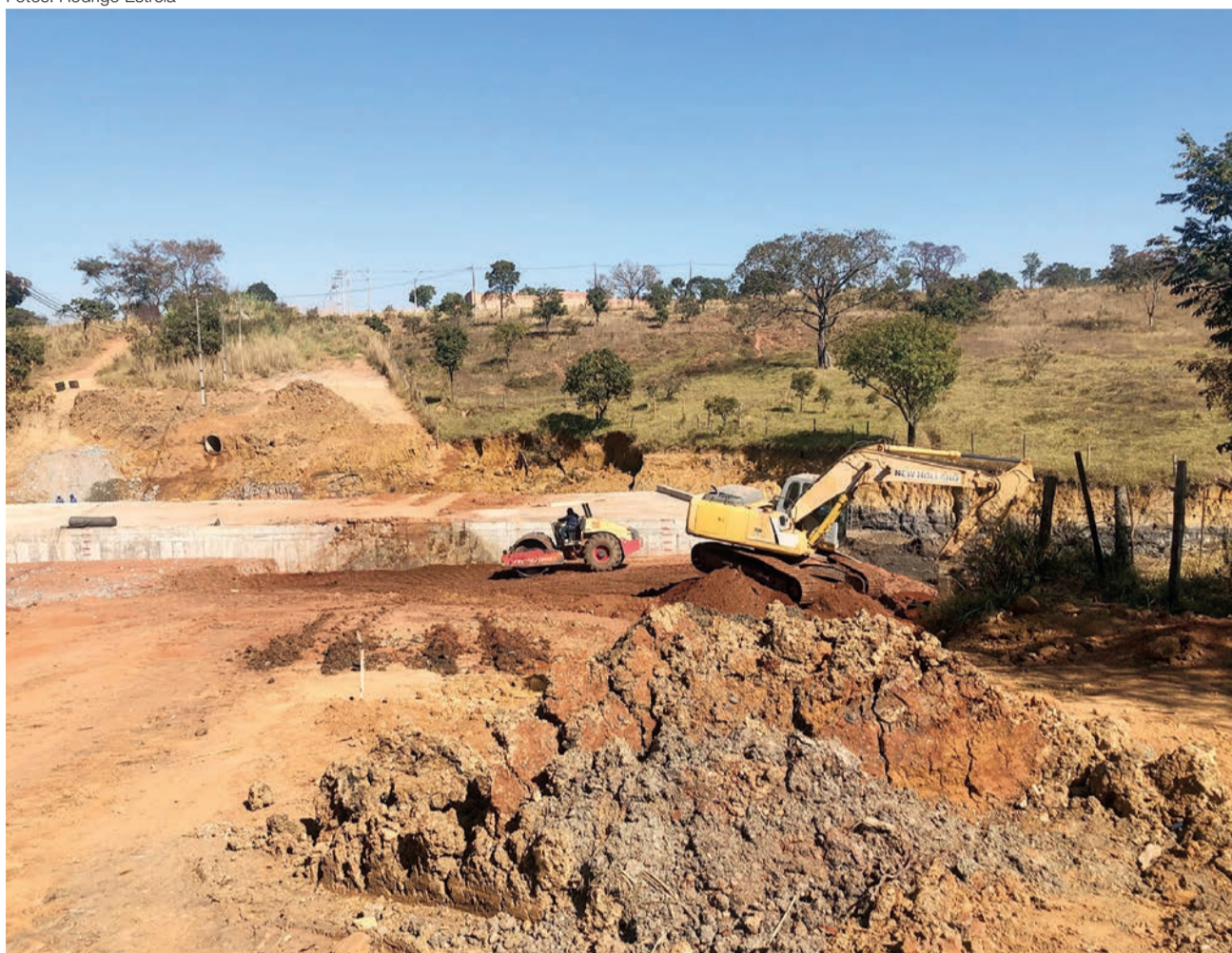
Vistoria nas obras de construção do Eixo Leste Oeste 1