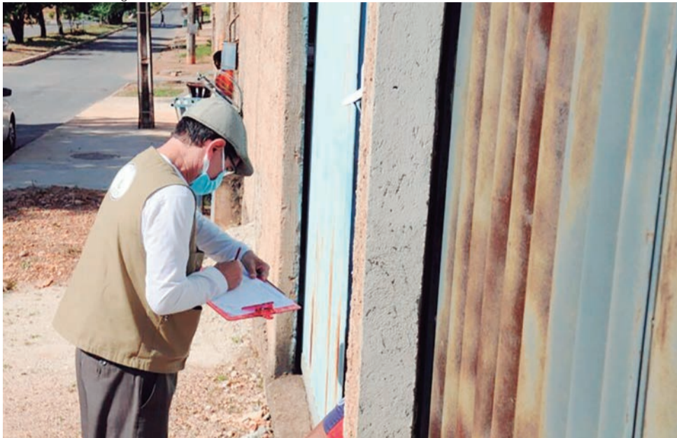
Agentes comunitários de saúde e de vigilância ambiental estão entre os profissionais a serem contratados

RAFAEL SECUNHO/AG. BRASÍLIA - Mil profissionais serão contratados temporariamente pelo Governo do Distrito Federal (GDF) para trabalhar na saúde pública: 500 agentes de vigilância ambiental e 500 agentes comunitários de saúde. Foi publicada, nesta quarta-feira (14), no Diário Oficial do Distrito Federal (DODF), a dispensa de licitação para contratação de uma empresa que organizará o processo seletivo. Além dessas vagas, será formado um cadastro de reserva com mais 500 oportunidades.