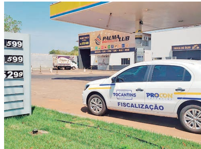
Por aumentar preços dos combustíveis, Procon notificou um posto em Palmas e outro em Araguaína

segmentos do comércio, em todo o Estado.