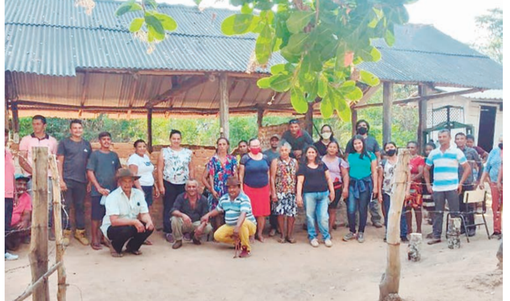
Reuniões fazem parte de mais uma das etapas de discussão do projeto pelo Governo do Tocantins

HENRIQUE LOPES/GOVERNO DO TOCANTINS - Ampliar o diálogo com as comunidades quilombolas, ouvi-las e esclarecer as dúvidas sobre o processo de participação nas audiências públicas referente à concessão de serviços de turismo nas áreas pertencentes ao Parque Estadual do Jalapão. Este tem sido o objetivo do Governo do Tocantins e do Banco Nacional de Desenvolvimento Econômico e Social (BNDES) durante as reuniões realizadas nas comunidades quilombolas do Jalapão.