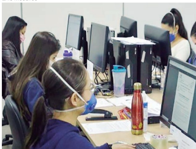
Telemedicina monitora pacientes com Covid-19 em Aparecida de Goiânia