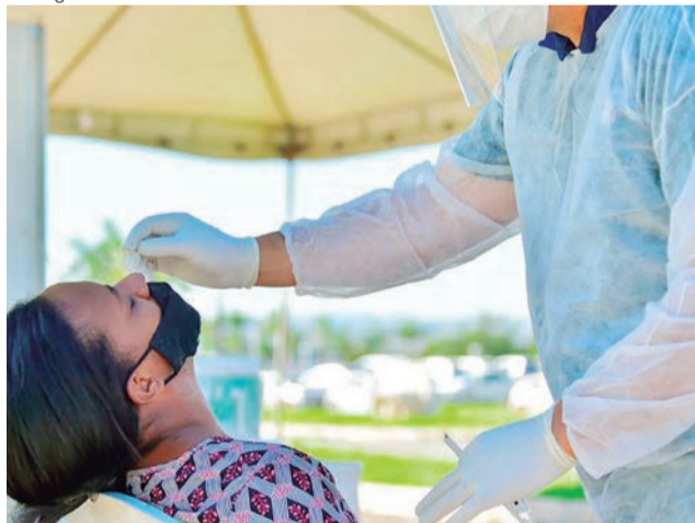
Aparecida realiza testagem em massa da população desde o início da pandemia

que Aparecida, ao contrário de cidades e estados brasileiros, conseguiu manter a economia ativa nos períodos mais críticos da pandemia.