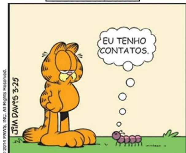
© 2014 PAVIS, INC. All Rights Reserved. JIM DAVIS 3-25