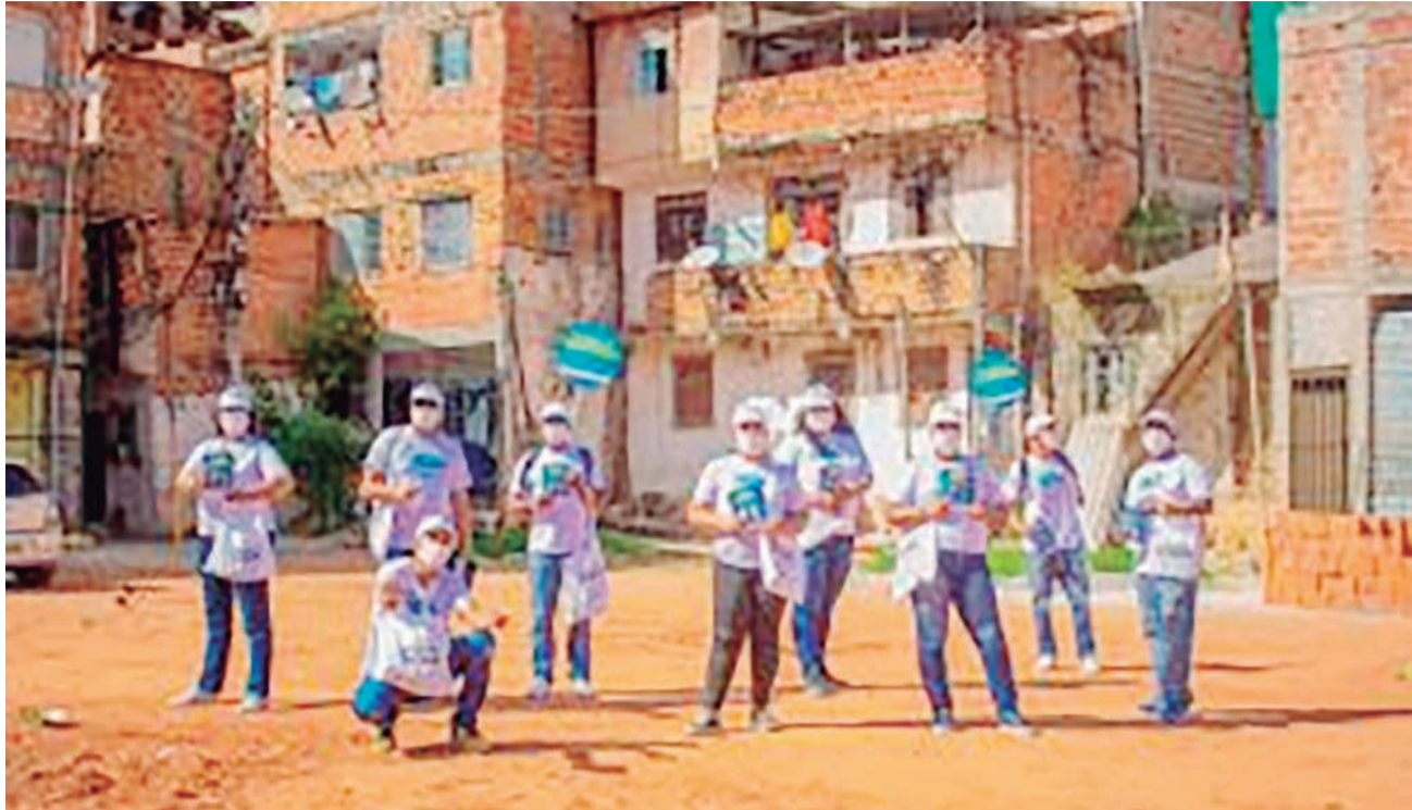
Ação de conscientização realizada em comunidades.

tre 2015 e 2020, a queda na cobertura da vacina contra poliomielite foi de 22,9% e a da BCG, 30,4%. Entre 2019 e 2020, a variação foi de -9,9% e -15,7% para poliomielite e BCG, respectivamente.