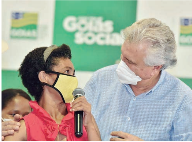
O governador Ronaldo Caiado, em Santo Antônio do Descoberto, durante entrega de cartões do Mães de Goiás, distribuição de Chromebooks e anúncio de ações no município

to asfáltico de vias urbanas, pelo programa Goiás em Movimento – Eixo Municípios, da Agência Goiana de Infraestrutura (Goinfra).